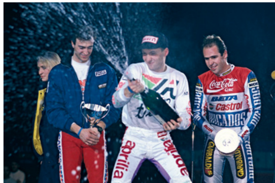
Diego Bosis se adjudicó el Trial Indoor de Barcelona de 1987, tras superar, entre otros, a Jordi Tarrés.

Diego Bosis, todo un mito e icono del trial italiano y mundial de los 80, falleció la semana pasada tras sufrir un fulminante ataque al corazón cuando se dirigía a trabajar en tren.