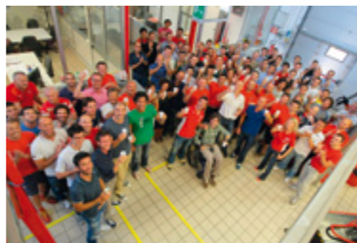
Carlos Checa, durante su visita en 2011 a Borgo Panigale.

Investindustrial, el fondo de private equity que controla la marca italiana desde 2006, ha confirmado su intención de venta.