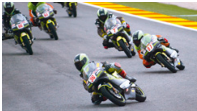
Las pruebas de selección para este 2012 se celebrarán el 26 de febrero en Ceste.

La nueva edición de este campeonato de formación creado en 1999 contará en 2012 con dos categorías menos convocadas: XL 160 4T y PreGP 125. Se mantienen, eso sí, Minimoto, MiniGP 90 4T y MiniGP 140 4T, clase esta última que nuevamente pondrá el punto y final a la presente edición con una exhibición en el GP de la Comunidad Valenciana de MotoGP, la última cita del Mundial. Este importante cambio, sin embargo, no es el único, ya que la próxima Cuna de Campeones Bankia pasará de las seis citas de 2011 a contabilizar un total de nueve esta temporada, disputándose siete de ellas en distintas partes de nuestro país, con lo que prosigue su imparable expansión a otras regiones españolas en pos de convertirse en la puerta de acceso más directa y completa al CEV. Así, por primera vez, se estrenarán como escenarios el circuito Renn Arena de Lluçmajor, en Palma de Mallorca; el Karting Motor