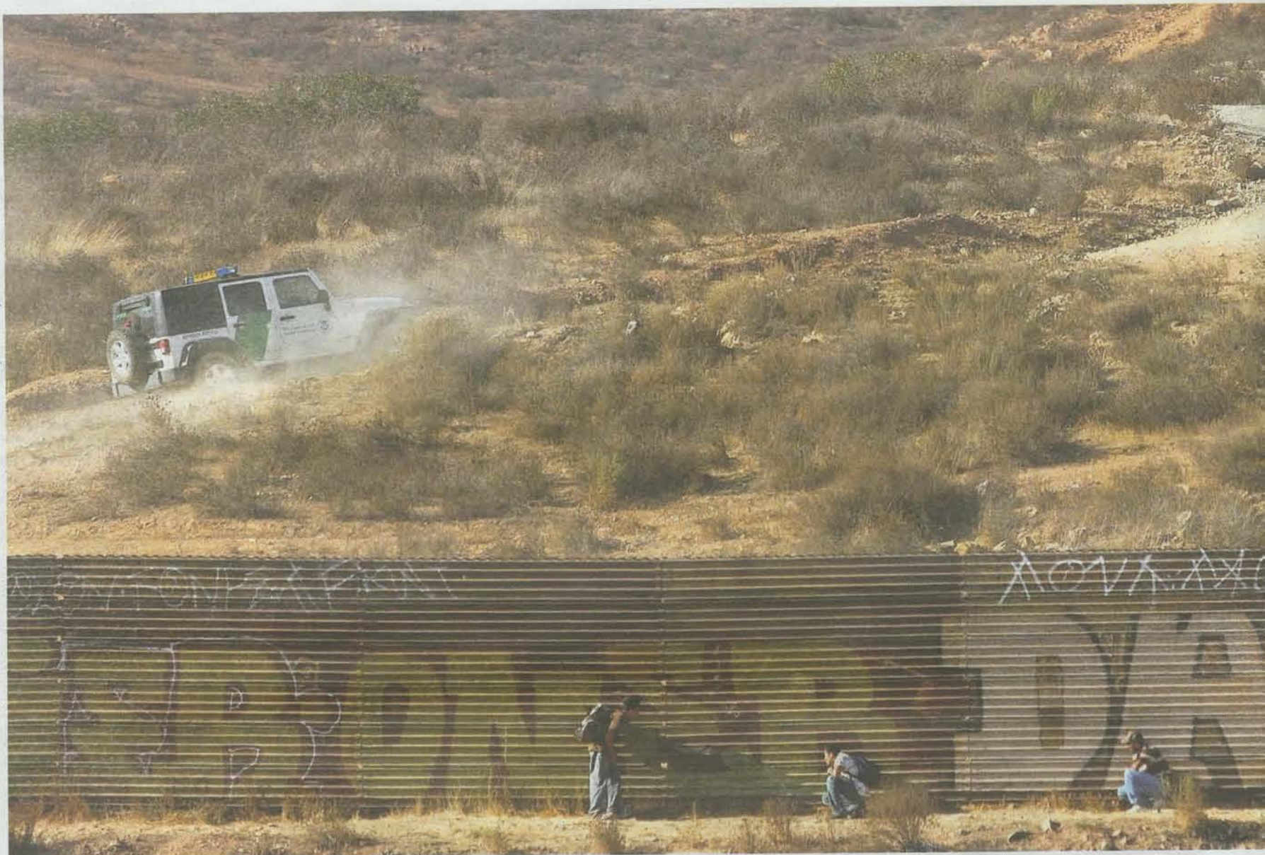
Frontera entre México y EE.UU. en Tijuana. Unos inmigrantes ilegales esperan la ocasión de entrar en territorio norteamericano