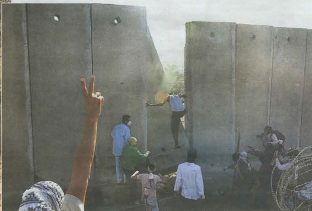
El muro israelí que cerca los territorios palestinos de Cisjordania