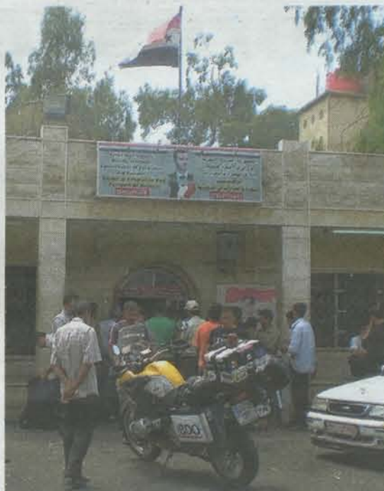
Los curiosos se arremolinan en torno a la moto del autor en la frontera siria