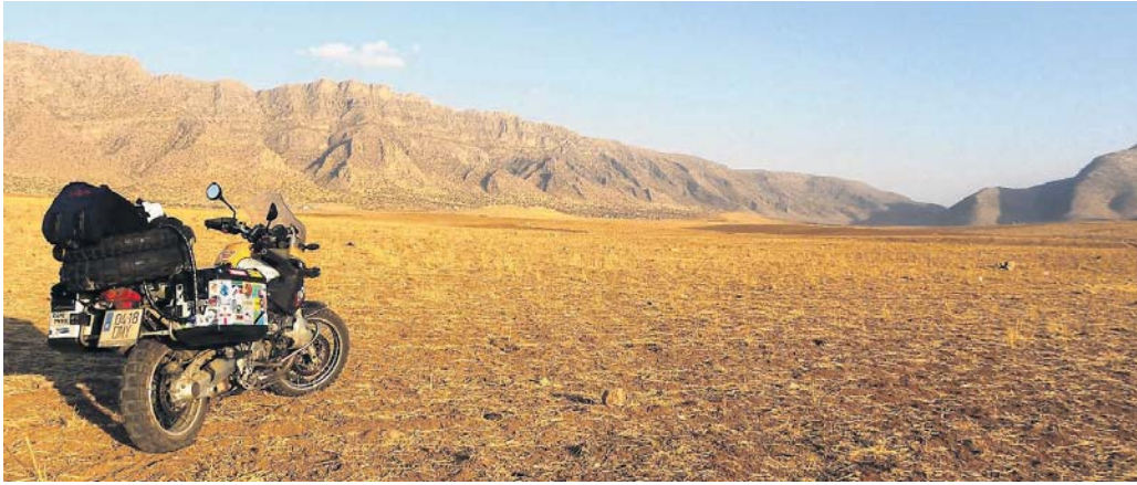
Uno de los paisajes del recorrido por Irak.