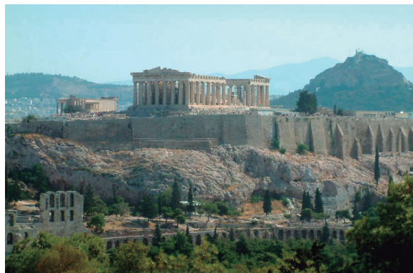
Acrópolis de Atenas

míticos capaces de vencer a cien guerreros. Aquí hay chusma cuartelera, cobardía y miedo. Lejos de la gran épica de Troya, encontramos una gran novela de viajes y un recorrido de saqueos y motines, de batallas sin gloria.