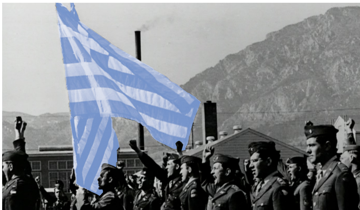
Soldados griegos en la II Guerra Mundial

El referéndum de Tsiaras apelaba directamente a esa respuesta emocional. Era una invocación al corazón herido de los griegos. De haber conocido esta historia de la Fiesta Nacional del No, habrían sobrado todos los análisis. Para cualquiera que la conociera, el resultado, con su tragedia adjunta, era inevitable. El No, aunque supusiera arrojarse al vacío de Anávatos, era el único modo de seguir siendo griegos. ■