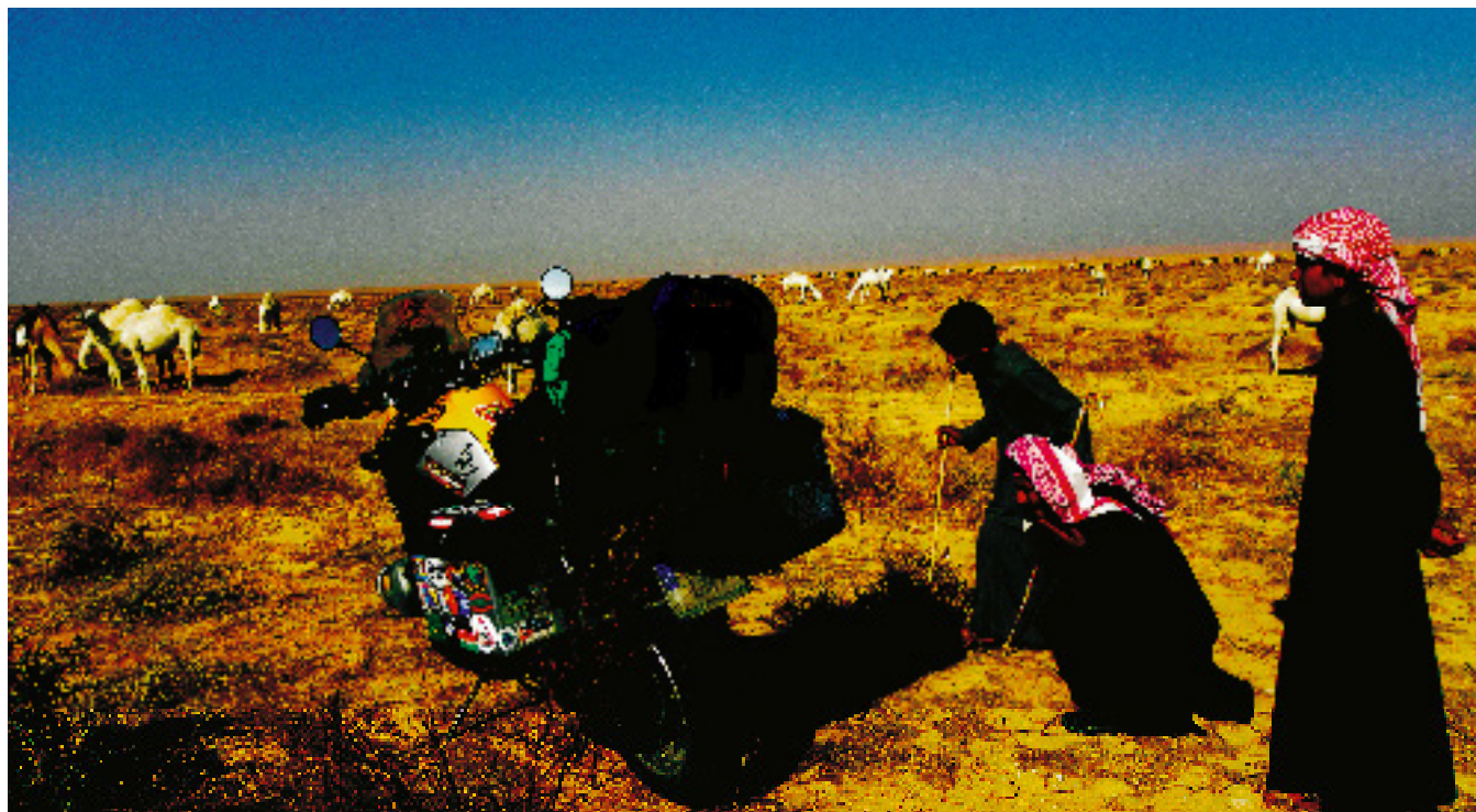
Curiosidad de los pastores sirios.

“ En su competición frenética, los periódicos, radios y televisiones llegan a creer que el mundo real es el frankenstein que construyen con twitters, grabaciones de móvil trincados al albur de la red o de lo que otros medios publican.