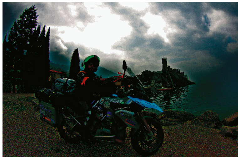
Delante de la fortaleza de Garda

No me hago ese tipo de consideraciones. Digo lo que opino, algunas veces seré incorrecto pero no intento serlo a pro-