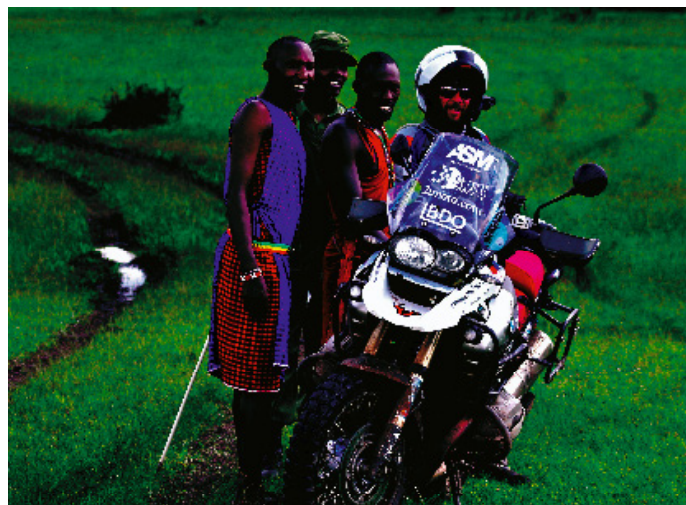
Con los masáis

En mi viaje transafricano en moto llegué a la frontera de Zambia y Zimbabwe a mediodía. En el puesto fronterizo se respiraba hostilidad y mal humor ácido. Aquellos funcionarios podían llevar meses sin cobrar sus salarios. No había simpatía ni voluntad de hacer las cosas fáciles al jodido extranjero blanco. Solicité un permiso temporal de importación para la moto. El oficial de policía responsable me atendió en un cuarto cerrado. Estábamos solos. Explicó que mis documentos keniatá no servían allí, que su país no los reconocía, que yo debía ofrecerle un título oficial que demostrase mi propiedad, ya que la moto podía ser robada. Con la insolencia del desesperado, insistí en mi propósito de llegar hasta Ciudad del Cabo. Traté de demostrar a aquel policía los muchos kilómetros que habíamos recorrido ya. Si fuera robada, no habríamos llegado tan lejos. "Por favor", rogué, "comprenda usted que esto es muy importante para mí". "¿Importante?". El agente cambió de lado el palillo de