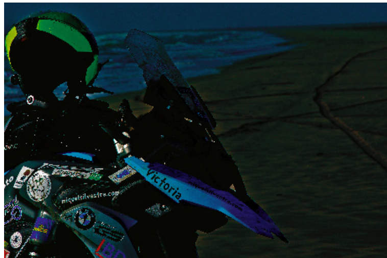
Victoria, compañera de viaje