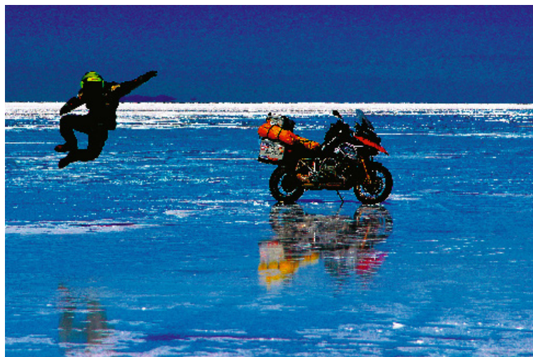
Disfrutando de un paisaje desconocido

oír un trepidante relato de bandidos o terroristas, una especie de película de acción con malos de opereta, de la que el héroe sale ileso por coraje o por astucia. He vivido algún momento de tensión, de enfermedad o de temor a un ataque. De hecho, en mi libro Un millón de piedras , en el que narro mi viaje por África, cuento que fue en Mauritania donde más miedo he pasado al quedarme sin gasolina en la ruta a Nouakchott durante la época en la que había tres españoles secuestrados, o lo mal que lo pasé al caer enfermo en Namibia sin asistencia posible. Pero eso son episodios aislados. La realidad es mucho más prosaica. Mi vida ha estado en peligro muchas veces, pero no por imaginarios villanos sino por el muy real riesgo del tráfico. Nos alarman los actos del terrorismo internacional. Ese terror mata a cientos, tal vez miles de personas, pero no prestamos oído siquiera a los muchísimos cientos de miles de muertos y mutilados, millones, que deja la circulación al año en todo el mundo. Esa sí una auténtica pandemia que diezma la población de los países en vías de desarrollo. No sólo mata a mucha gente, sino que arroja sobre las maltrechas economías familiares el deber de cuidado de muchísimos inválidos a quienes no protege ningún seguro ni ningún organismo público. El tráfico rodado está llenando el planeta de lápidas en los arcones y de discapacitados en los pueblos.